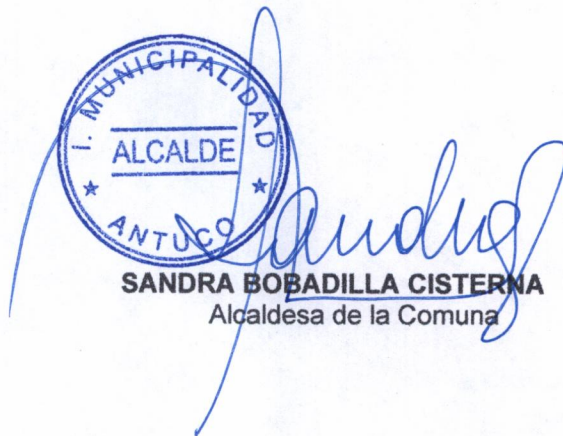
SANDRA BOBADILLA CISTERNA Alcaldesa de la Comuna