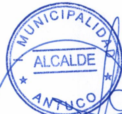
SANDRA BOBADILLA CISTERNA ALCALDESA